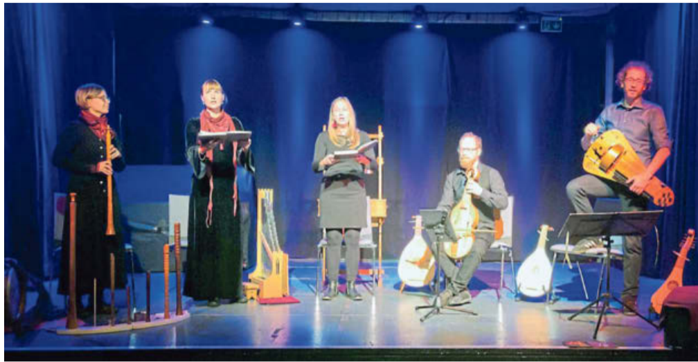
Das Ensemble Nimmersêlich gründete sich 1999. Weil eine Band ausfiel, konnten sie dem Publikum in Minden ein breites Repertoire bieten.