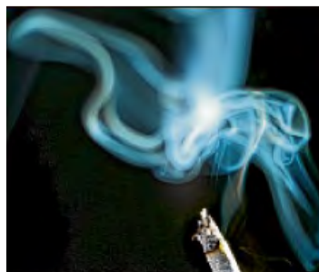
Bei der VHS findet heute eine Informationsveranstaltung zu dem Thema „Rauchfrei mit Hypnose“ statt.

Kneipp-Verein, Übungsabend, Seniorenzentrum Robert-Nussbaum-Haus, Brüderstraße 16, Minden, 19.30-21.30 Uhr.